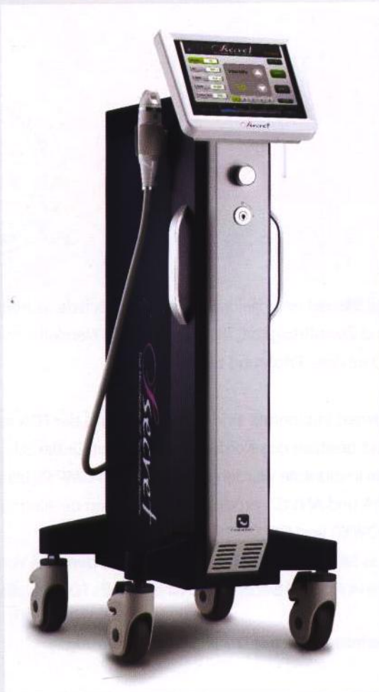
Abb. 1: RF Secret.

Mit den verschiedensten Behandlungsmöglichkeiten wird seit Jahren versucht, der Hautalterung entgegenzuwirken. RF Secret ist ein auf Radiofrequenz basierendes, fraktioniertes Mikronadel-System. Die Nadeltiefe ist von 0,5 mm bis 3,5 mm (in 0,1-mm-Schritten) variierbar, wodurch sich ein breites Behandlungsspektrum eröffnet.